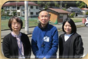
小規模多機能施設 担当ケアマネ