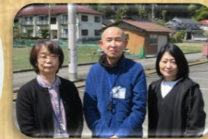
小規模多機能施設 担当ケアマネ