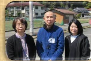
小規模多機能施設 担当ケアマネ