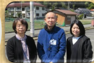
小規模多機能施設 担当ケアマネ