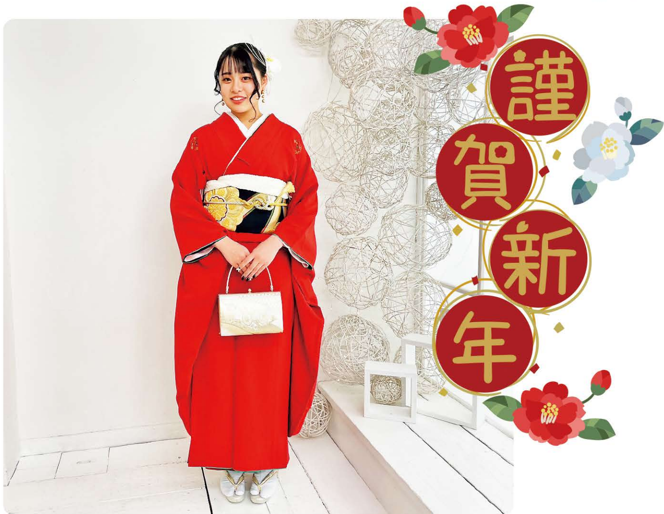
※昨年の二十歳を祝う会で、振袖をご利用いただいた方です。