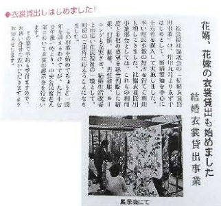
事業開始翌年の広報記事