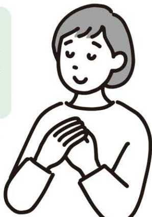
【お届けした品物の一例】