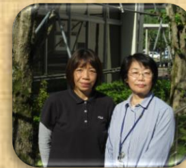
小規模多機能施設 担当ケアマネ