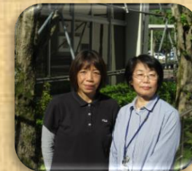
小規模多機能施設 担当ケアマネ